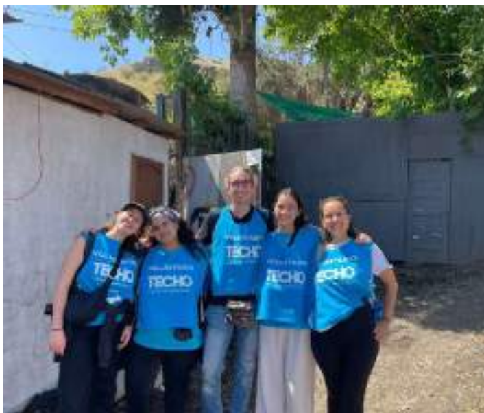
El grup de voluntàries participant de la segona part del projecte.

Per a mi ha estat un desafiament molt gratificant treballar amb comunitats vulnerables. Saber que les accions que hem realitzat tenen un impacte real i positiu en la vida de les persones de la comunitat.