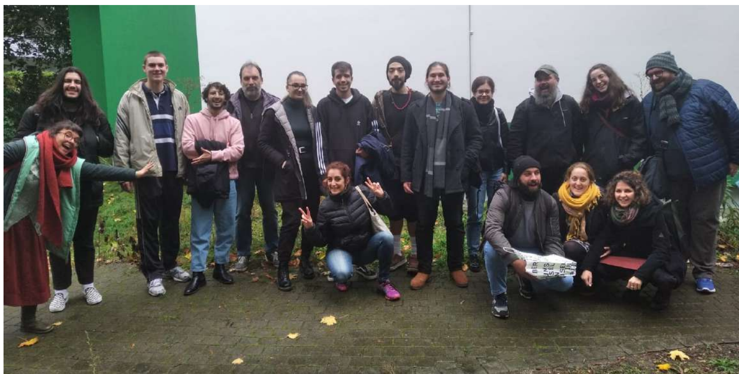
El grup de dinamitzadores juvenils internacionals que van participar al "Standards for Open Youth Centers in Europe".

Anar a un seminari a treballar i debatre durant 8 hores al dia pot semblar una activitat no gaire emocionant, però al cap i a la fi t'enriqueix. Convido a tothom a explorar noves oportunitats, a millorar, a trobar noves eines personals i a aprofitar tot el que se'ns presenta.